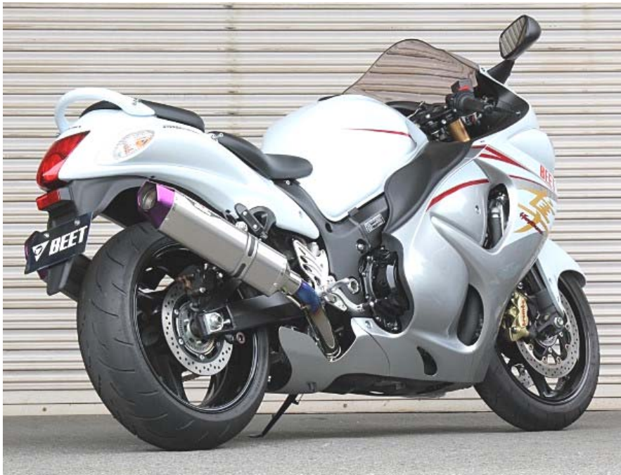
上記画像は、廃盤品のクリア・ピンクパープルサイレンサー仕様です。

フラッグシップモデルに相応しい 2 本出しの迫力ある外観と、スリップオンマフラーとする事でマフラー交換の煩わしさを軽減した上で、相反する動力性能と環境性能を高次元でバランスさせた逸品です。