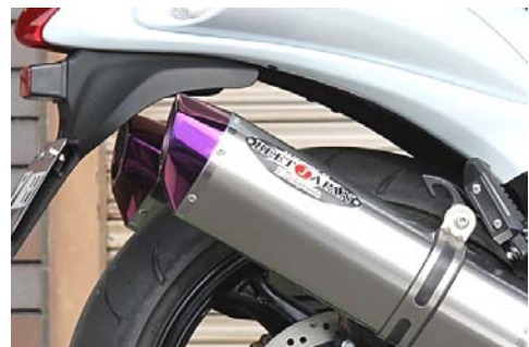
ピンクエンドサイレンサー仕様は廃盤となりました。