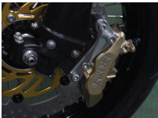
08- D-TRACKER X 用