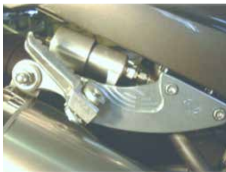
付属タンデムキット