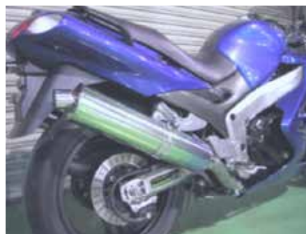
ZZR-1200 New NASSERT-R T-2 スリップオンマフラー