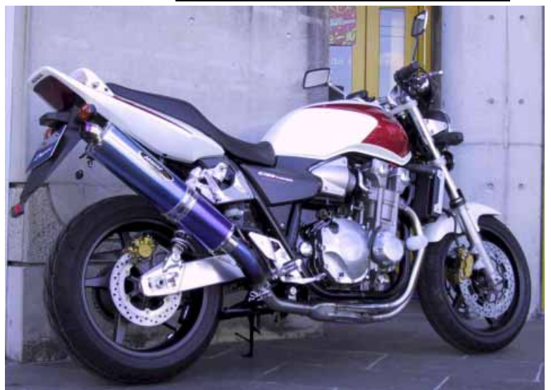
New NASSERT-R スリップオン TI/BL

センターパイプ 60.5φ チタン サイレンサー 120φパルスコーン チタン or カーボン or ブルー