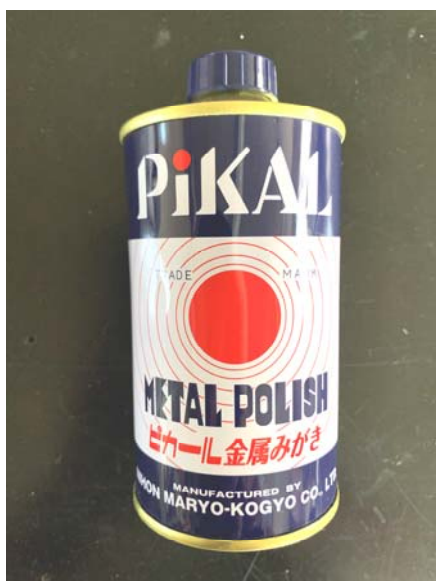
ピカール金属みがき

※ブルーチタン / クリアチタンサイレンサーや、エンブレム、マフラー本体、バックステップなどには、ピカールはご使用いただけません。色落ちの原因となりますのでご注意ください！